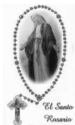
Dama Blanca de la Paz