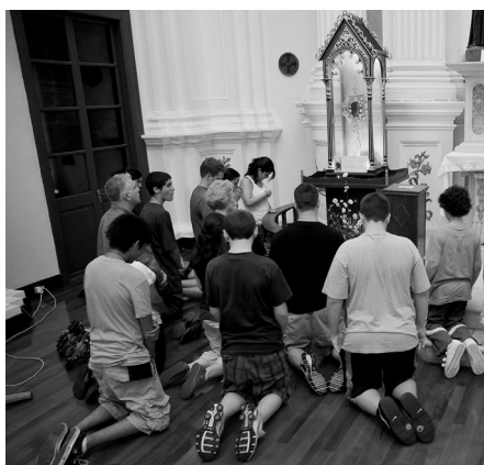
Reunión familiar para rezar el Santo Rosario

La Santísima Virgen nos ha advertido que la furia de Satanás es cada vez mayor, pues sabe que no le queda mucho tiempo para conseguir sus propósitos de quitar almas al Creador y perderlas para siempre. Satanás conoce que ese es el mayor dolor que puede infligir a Dios, su eterno enemigo. Su único fin es perder a los