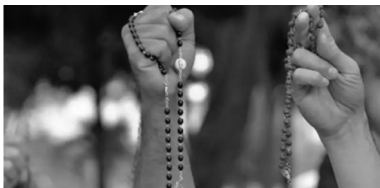
Rosario de Hombres Perú

Más allá de ser una simple rutina de oración, la Campaña del Rosario de Word on Fire aspira a ser un momento de encuentro y renovación espiritual para todos los participantes. La organización ofrece guías de oración, reflexiones diarias y testimonios inspiradores para enriquecer la experiencia del rezo del Rosario y