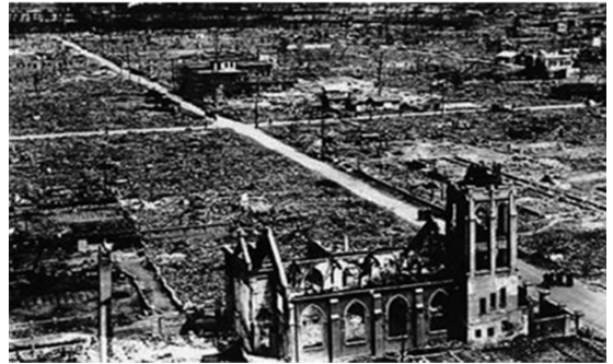
La bomba atómica de Hiroshima lo destruyó todo a su paso... salvo una casa parroquial a un kilómetro y medio del lugar de lanzamiento: los sacerdotes que allí residían, devotos del Rosario, vivieron y no les afectó la radiación.

animó a muchos a rezar el Rosario. Fue uno de los evangelistas televisivos pioneros que utilizó el medio para promover el Reino de Dios. En 1992, falleció en paz con un rosario en sus manos y ahora está siendo considerado para iniciar el camino de canonización.