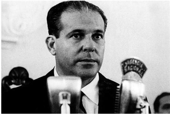
El presidente de Brasil y acérrimo comunista, Joao Goulart, fue derrocado tras la denominada 'Marcha de la familia con Dios hacia la libertad', con un importante papel del Rosario.