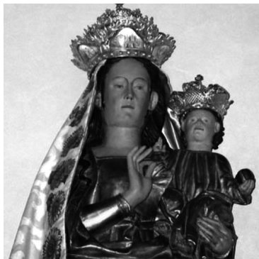
Nuestra Señora de Las Gracias Año: 1519 - Lugar: Cotignac Vidente: Jean De La Baume