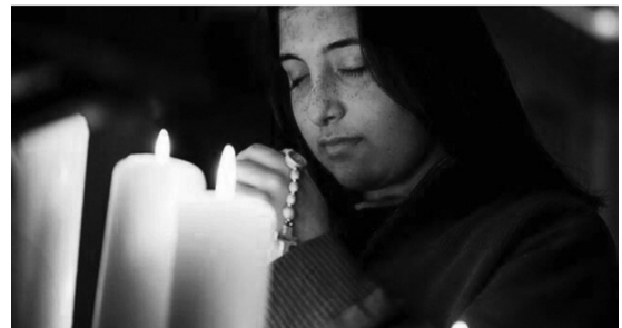
Una joven reza el Rosario entre velas

Y las gracias que recibimos nos acercan más a Jesús: ya sea la fuerza y la paz para