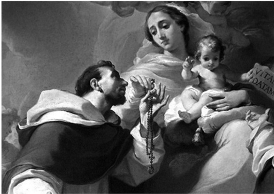
Santo Domingo recibe de la Virgen el Santo Rosario.