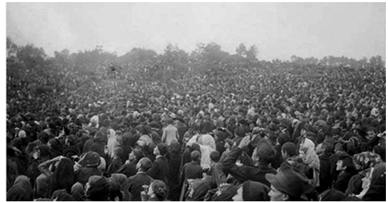
Milagro del sol en Fátima, Portugal, donde la Virgen pidió que se rezara el Rosario todos los días para traer la paz al mundo y poner fin a la Primera Guerra Mundial.

En “El secreto del rosario”, san Luis María Grignon de Montfort escribió sobre la devoción de Santo Domingo: “Como recompensa recibió innumerables gracias de ella; ejerciendo su gran poder como Reina del Cielo, coronó sus labores con muchos milagros y prodigios”, escribió. “Dios Todopoderoso siempre le concedió lo que pidió a través de Nuestra Señora. El mayor honor de todos fue que ella lo ayudó a aplastar la herejía albigense y lo convirtió en el fundador... de una gran orden religiosa”.