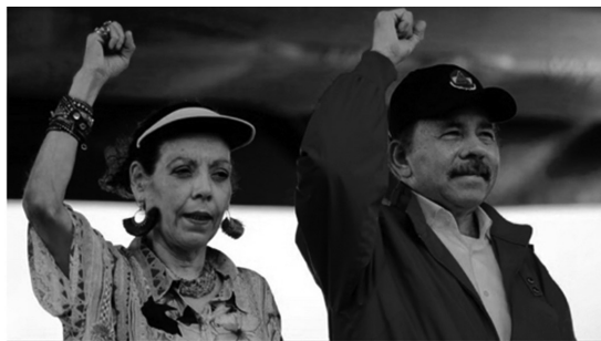
Dictador de Nicaragua Daniel Ortega y su esposa

Junto a los dos nuevos arrestos el Gobierno de Nicaragua canceló este lunes la personalidad jurídica a la Asociación Cáritas Diocesana de Matagalpa (Cáritas de Matagalpa) y otras 14 asociaciones que funcionaban como organismos