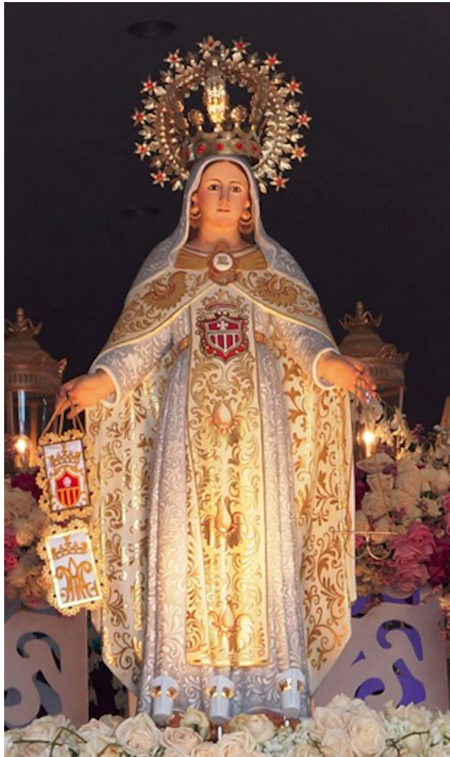
Nuestra Señora de la Merced

INFORMATIVO DE LAS APARICIONES DE LA SANTISIMA VIRGEN EN EL MONTE CARMELO, PEÑABLANCA - CHILE