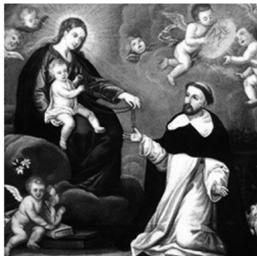
Nuestra Señora del Rosario Año: 1208 - Lugar: Prouille Vidente: Santo Domingo de Guzmán

Han sido las Apariciones de la Virgen en Francia reconocidas más largas de la historia,