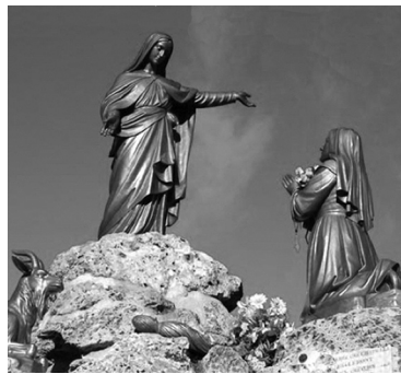
Nuestra Señora de Laus Año: 1664 - Lugar: Saint Etienne Le Laus Vidente: Benoîte Recurel