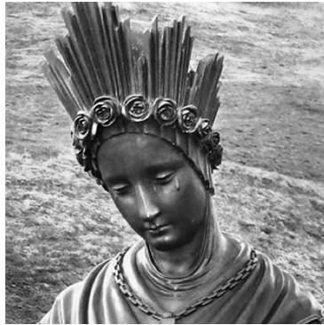
Nuestra Señora de La Salette Año: 1846 - Lugar: La Salette Videntes: Maximino y Melanie