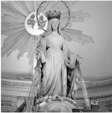
Virgen de la Medalla Milagrosa Año: 1830 - Lugar: París Vidente: Catalina Labouré