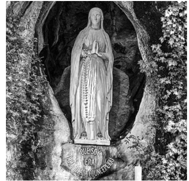
Nuestra Señora de Lourdes Año: 1858 - Lugar: Lourdes Vidente: Bernadette Soubirous

se prolongaron durante 54 años y no se reconocieron oficialmente hasta el año 2008.