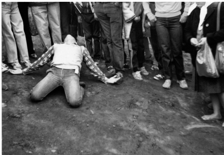
Miguel Ángel en éxtasis doblado hacia atrás y rodeado de fieles.

OS PIDO PAZ EN VUESTROS CORAZONES. OS PIDO QUE SAQUÉIS TO-