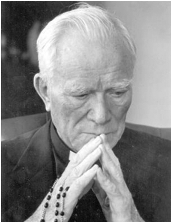
El sacerdote Patrick Peyton, diagnosticado en 1938 de una tuberculosis avanzada, incurable por entonces, fue sanado milagrosamente tras rezar el Rosario.

María, por el cual he sido liberado de la condenación eterna!’ Después de que recuperó su salud, pasó el resto de su vida difundiendo la devoción al Santo Rosario y lo rezó fielmente todos los días”.