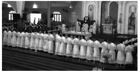
Ordenaciones en Nsukka (Nigeria), 2024

En unas palabras pronunciadas al término de la ordenación sacerdotal, el obispo Godfrey Igwebuike Onah expresó su gratitud y alegría por el creciente número de sacerdotes que prestan servicio en su sede episcopal. El tono de su mensaje y de la homilía quizá pueda servir de inspiración a otros preladados de naciones antiguamente cristianas y que no se queden en el falaz argumento de que «ahora somos más auténticos». «Debo presentar una disculpa a