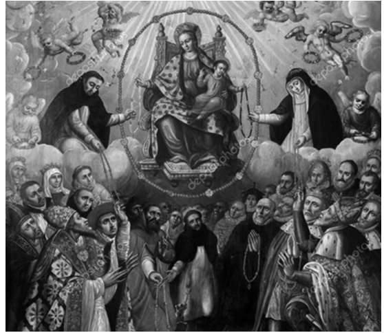
Uno de los muchos cuadros que retratan la devoción universal de la Iglesia por María y el rezo del Santo Rosario.

acción de gracias a Dios", incluyó a más de un millón de personas.