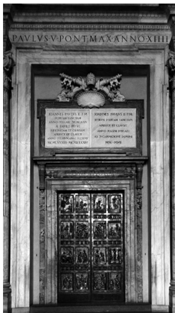
Puerta Santa, Basílica de San Pedro

El paso a través de una Puerta Santa durante el Jubileo simboliza la entrada en una nueva vida en Cristo y el inicio de un camino de conversión. La bula describe este acto como una “experiencia viva del amor de Dios, que suscita en el corazón la esperanza cierta de la salvación en Cristo.”