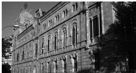
Tribunal Superior de Justicia de Cataluña I

Tras examinar la documentación aportada, el juzgado señala duramente que «no considero que concurra un padecimiento grave, crónico e imposibilitante que como nos describe la Ley es la situación que hace referencia a limitaciones que inciden directamente sobre la autonomía física y actividades de la vida diaria, de manera que no permite valerse por sí mismo, así como sobre la capacidad de expresión y relación, y que llevan asociado un sufrimiento físico o