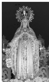
Nuestra Señora de la Merced