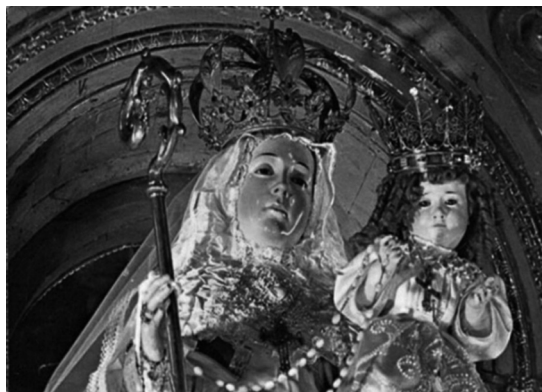
Nuestra Señora del Buen Suceso de Quito

Y en lo que respecta el sacramento del matrimonio, será atacado y profanado profundamente... el espíritu católico va a ser rápidamente contaminado, la preciosa llama de la Fe será