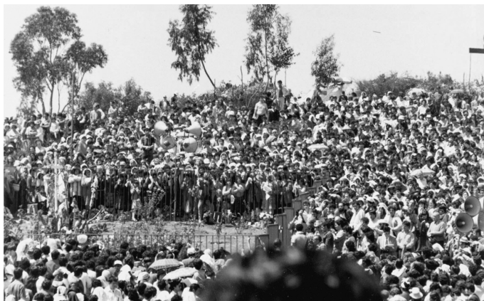
Miles de fieles rodean el lugar del futuro jardín durante la Aparición del 7 de octubre de 1983.