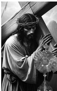
Cuaresma 2025: "Ayudadme a cargar mi Cruz"