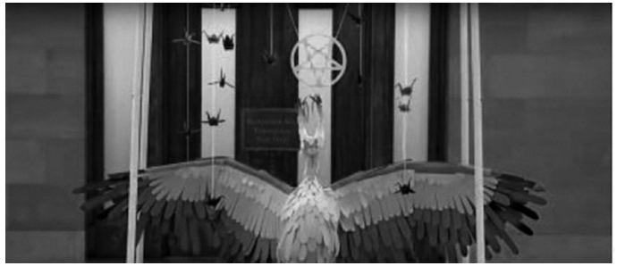
Representación satánica en el Capitolio de Minnesota (Estados Unidos), durante la Navidad pasada, con la inscripción: ‘Tú eres tu propio Dios’. CAPTURA

Sin embargo y, desafortunadamente, los erróneos dogmas del liberalismo se han infiltrado de tal modo en nuestra sociedad que varios, aun algunos cristianos, ven la blasfemia y el sacrilegio como un mal que es necesario a fin de conservar la libertad de expresión. Por ello, haciendo gala de una tolerancia volteriana, defienden la expresión pública de cualquier creencia, opinión y/o práctica religiosa por equivocadas, ofensivas o perversas que sean, pues reprimir el error se les antoja más abominable que la misma blasfemia. Otros, ante las blasfemias y puestas sacrílegas aconsejan prudencia, diálogo y evitar caer en provocaciones. Al parecer, la justa indignación y calificación de la afrenta es vista como contraria a nuestras “múltiples libertades”, en las cuales se incluye la llamada “libertad de ofender” (siempre que la ofensa se dirija al cristianismo, claro está), ya que la realidad objetiva se ha sustituido por experiencias, sentimentalismos y deseos subjetivos que conforman los dogmas intocables de los progresistas