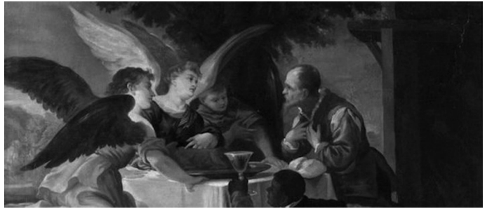
Abraham y los tres ángeles' (detalle, 1668), de Juan Antonio de Frías y Escalante. Museo del Prado

Sin embargo, el último Catecismo de la Iglesia Católica, promovido y promulgado por San Juan Pablo II, y en buena medida organizado y escrito por el que más adelante fuera su sucesor, Benedicto XVI (es decir, por un filósofo y un teólogo que pertenecen a la modernidad), no ha cambiado su parecer acerca de los espíritus puros, que tienen encomendada la misión de actuar como servidores y mensajeros de Dios. No en vano, desde el primero de los Libros Sagrados aparecen como compañeros de avatares de los hombres insignes del Antiguo Testamento. Y son ángeles los que acompañan la vida terrenal de Cristo, su Resurrección y Ascensión al cielo, incluso algunos de los episodios más emotivos de los primeros pasos de la Iglesia recién instituida. Saber de su existencia es un don del Cielo, que nos permite conocer su presencia constante en la liturgia, y confiar en la asignación de un protector escogido y único